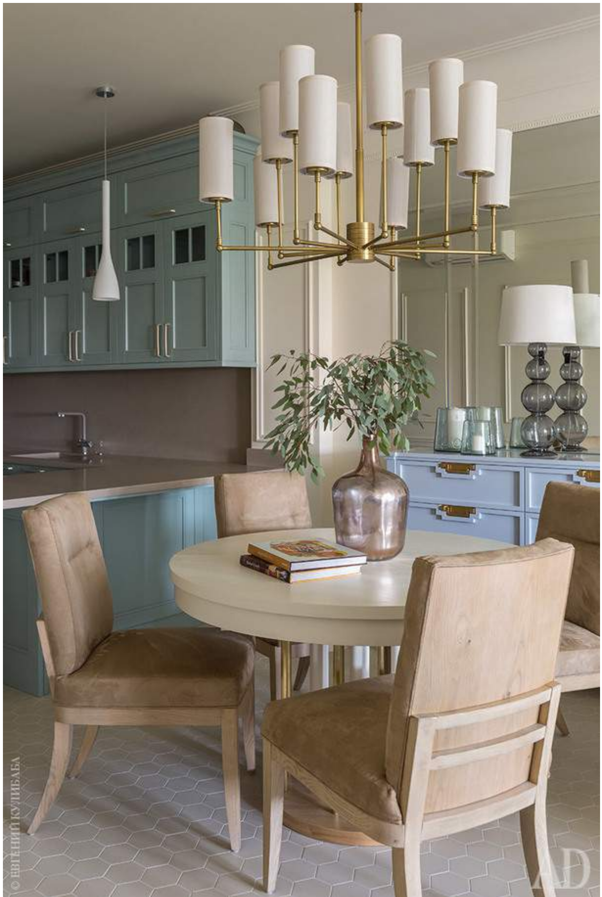
Столовая и кухня. Стол и комод, Any-Home; стулья, American Interiors.