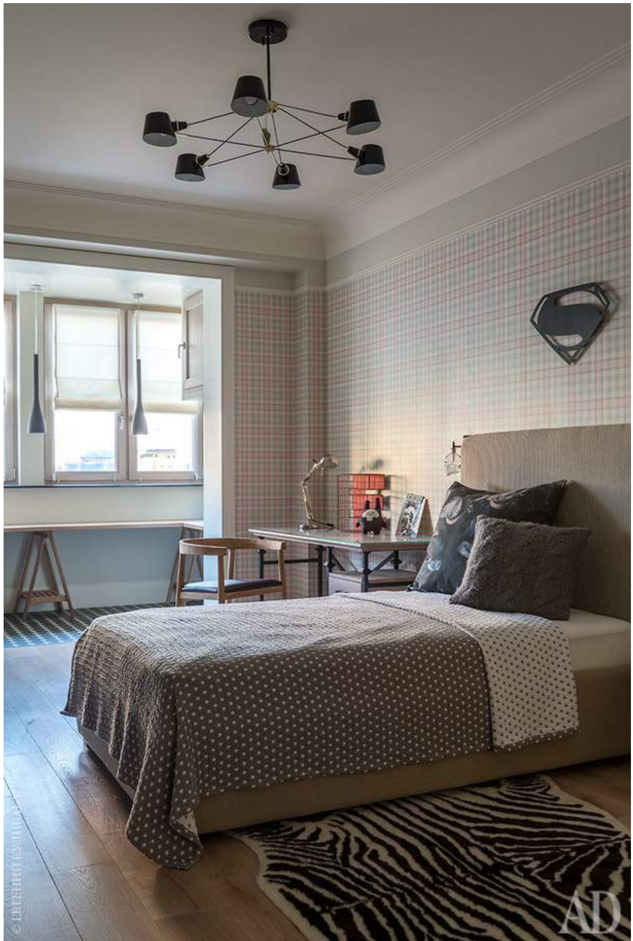
Спальня старшего сына. На лоджии — длинный игровой стол, на котором мальчик, фанат лего, раскладывает свою коллекцию. В предыдущей квартире все поверхности детской были завалены игрушками.