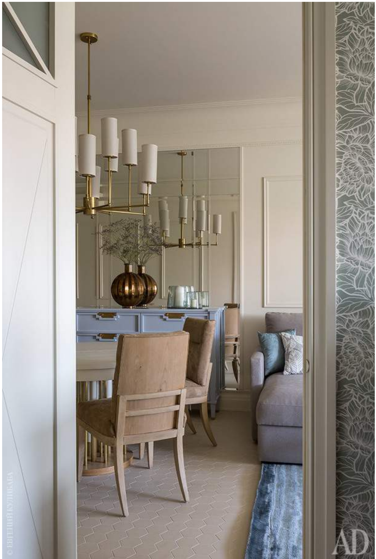
Вид из коридора на столовую. Межкомнатные двери выполнены на заказ по чертежам автора проекта.