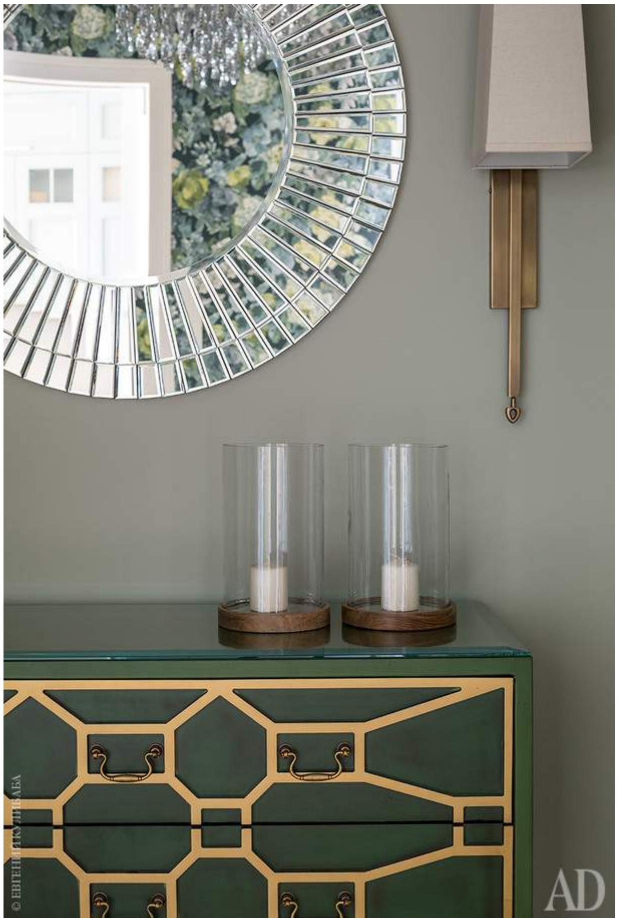
Холл, который дизайнер называет “сердцем квартиры”. Комод, зеркало и бра куплены в The Furnish.

Комната старшего сына, которую его родители попросили сделать нейтральной по цвету и стилю, в результате получилась скучноватой, но стоило нанести на шкаф роспись в стиле граффити, и скука пропала.