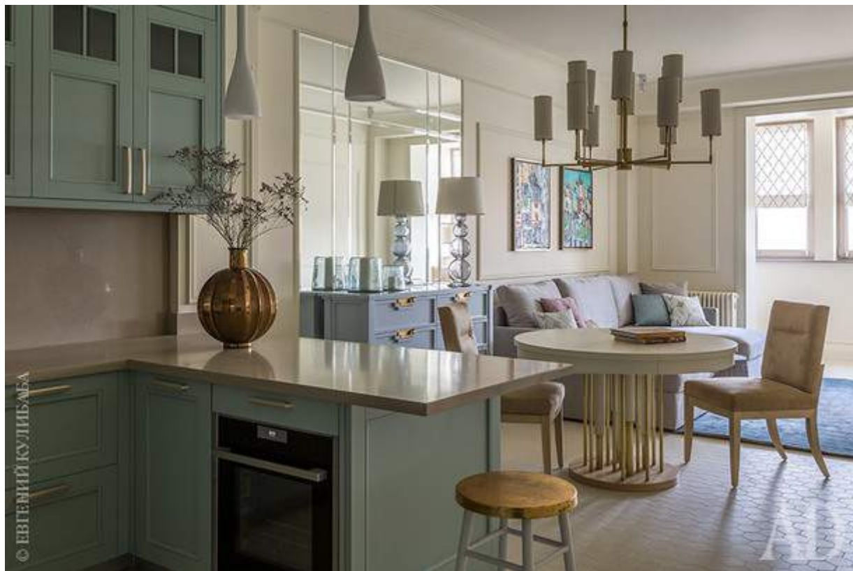
Вид из зоны кухни на столовую и гостиную. Диван изготовлен на заказ в мебельной мастерской DNK-Interior. Ковер, Art de Vivre.

полезная для саморазвития: “Мы справились с этим вызовом, научились быть гибче, сенситивнее в общении с клиентами, и в итоге все завершилось на хороших эмоциях и полном доверии”.