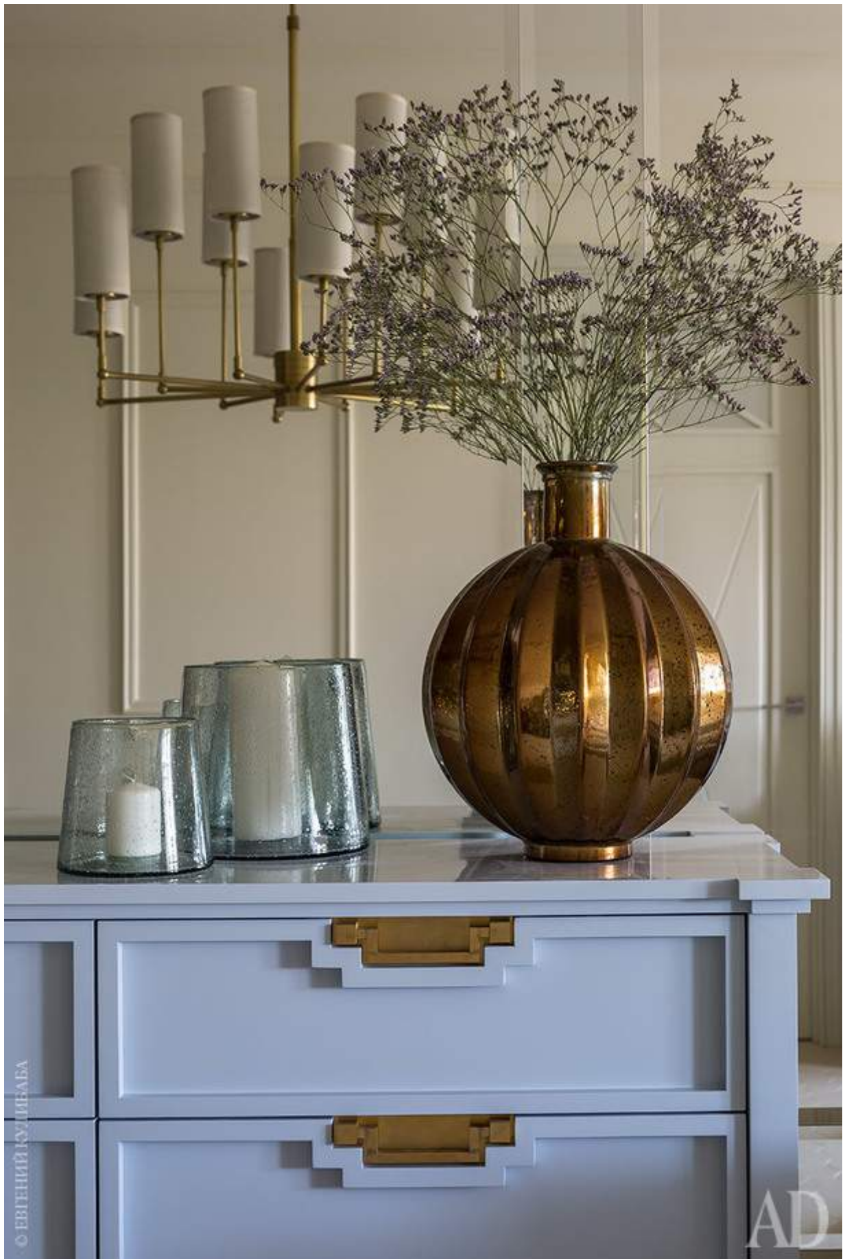
Фрагмент столовой. Комод, Апу-Home; декор, NAF-NAF House.