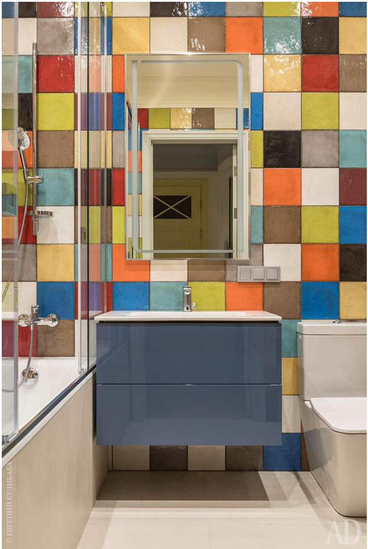
Детская ванная комната. Плитка, gim.ru. Сантехника, "Макслевел".