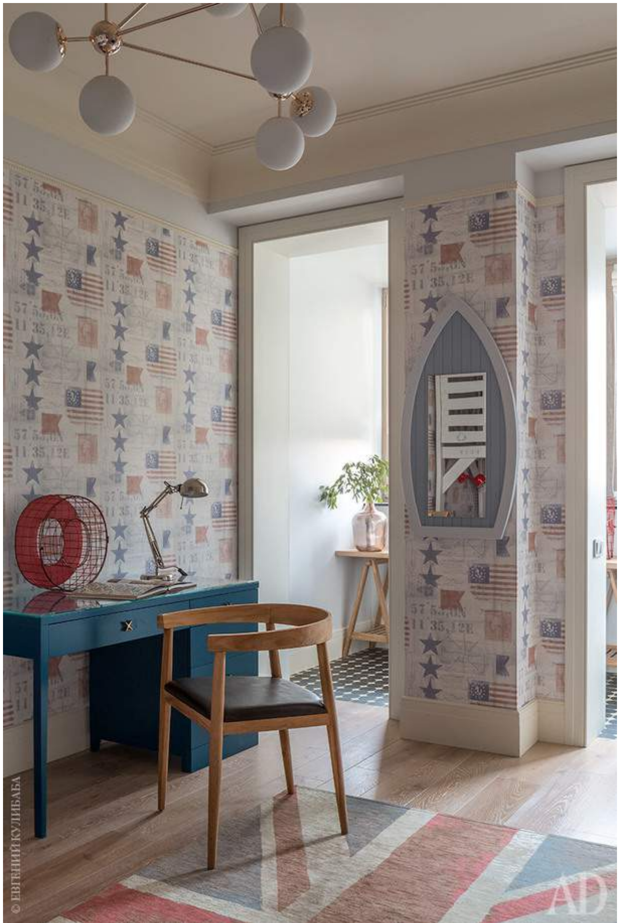
Фрагмент детской. Стол, The Idea. На лоджии — еще один стол, игровой.